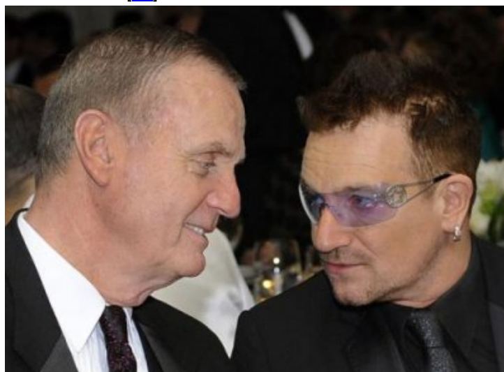
Bono et le général Jim Jones

Enfin, la chanteuse née en Grande-Bretagne de parents kosovars, Dua Lipa [12], fut la dernière à recevoir le Distinguished Leadership Award 2021 - Artistic [13]. Rappelons qu'en 2010, ce fut le chanteur Bono qui avait reçu le prix du « Leadership humanitaire », avec à ses côtés le général français Stéphane Abrial, assurant l'un des deux commandements « suprêmes » de l'OTAN [14].