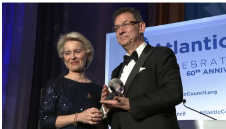
Ursula von der Leyen - présidente de la Commission européenne et Albert Bourla - directeur général de Pfizer

Lors de son 60e anniversaire en novembre dernier, l'Atlantic Council, think tank ayant son siège à Washington et « très bien classé » aux USA par l'Université de Pennsylvanie [1], a tout d'abord décerné un Distinguished Leadership Award 2021 - International à Ursula von der Leyen « pour son attachement à préserver les liens transatlantiques » [2]. Elle a en particulier déclaré : « Le fait que l'Atlantic Council me le décerne en tant que "citoyenne européenne et transatlantique" signifie beaucoup pour moi. C'est exactement ce que je ressens : une citoyenne européenne et transatlantique. » [3] Elle a également évoqué la politique numérique transatlantique et le Conseil du commerce & des technologies UE-USA.