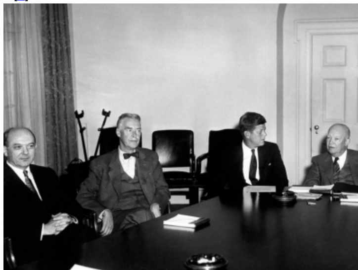
De gauche à droite : Dean Rusk, Christian Herter, John F. Kennedy (président élu) et Dwight D. Eisenhower. Dans la salle du Cabinet, à la Maison Blanche, à Washington, D.C.

Christian Herter, prédécesseur de Dean Rusk en tant que secrétaire d'État du président Dwight D. Eisenhower, fut le premier président de l'Atlantic Council en 1961 et il avait « une vision qui allait bien au-delà de la communauté transatlantique de l'époque » [4].