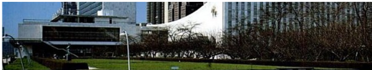
Deux vues du Palais de l'ONU en bordure de l'East River.