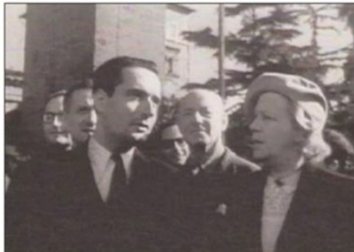
François Mitterrand à Rome, le 18 novembre 1948, au congrès de l'Union européenne des fédéralistes.